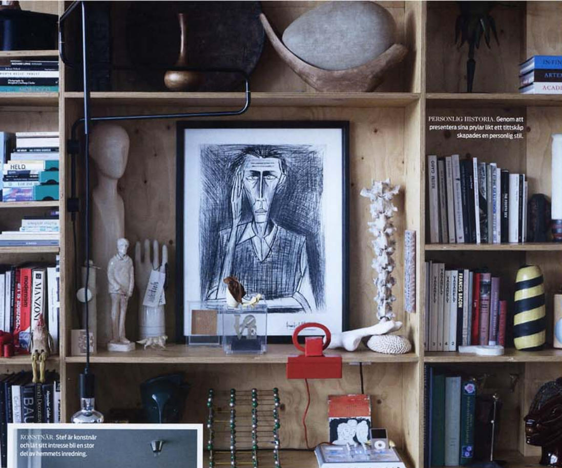
PERSONLIG HISTORIA. Genom att presentera sina prylar likt ett tittskåp skapades en personlig stil.